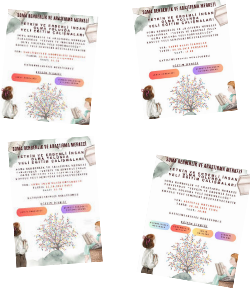
Ekim ayı Çalışmaları

Bu çalışma, Soma Kaymakamlığının proje oluru, Soma İlçe Milli Eğitim Müdürlüğü'nün desteğiyle Soma Rehberlik ve Araştırma Merkezinde görevli psikolojik danışmanlar tarafından, okullarda öğrenci ve veli çalışmaları yapılarak devam edecektir.